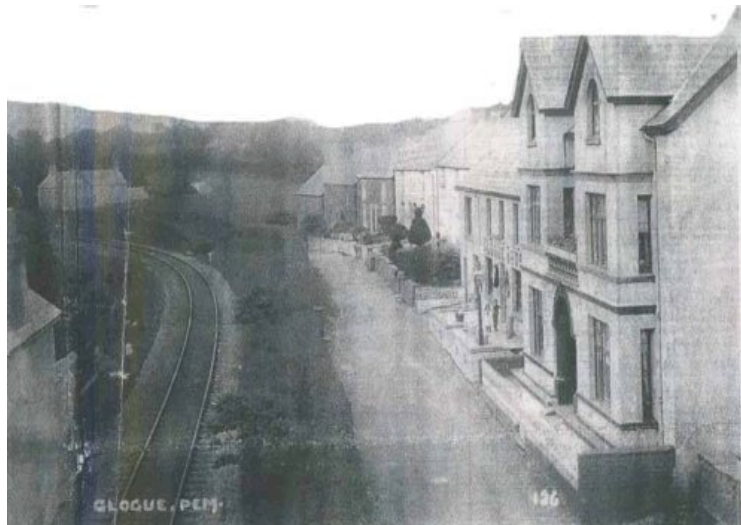
Llun o'r Glog

Bu gan Hermon chwe siop, gan gynnwys swyddfa bost a garej. Cysylltwyd y pentref â chwareli plwm ac arian y Glog. Roedd hynafiaid busnes teulu Cwmni Mansel Davies yn ofaint i'r chwareli plwm, ac yna ehangwyd y gwaith i gynnwys peirianwaith amaethyddol, ac wedyn datblygwyd busnes y teulu i'r hyn yr ydym yn ei adnabod heddiw.